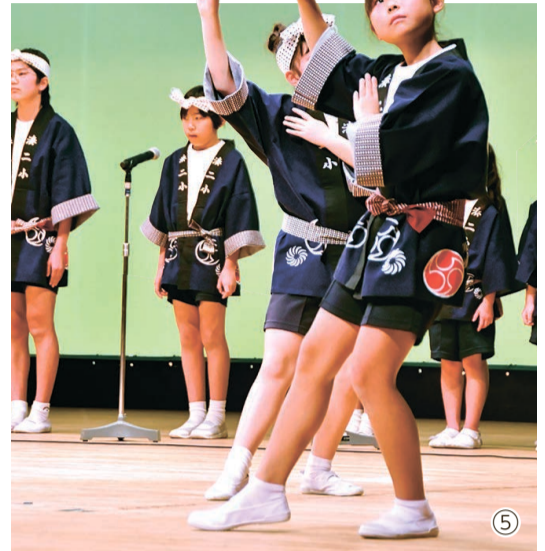
①元町みろく保存会 ②清心保育園 ③東石川小学校 ④磯節道場 ⑤那珂湊第二小学校