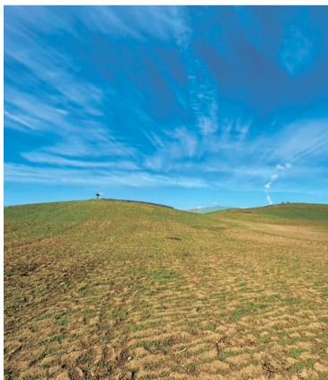
春の絶景に向けネモフィラ成長中(国営ひたち海浜公園/2月10日撮影) 市公式 Instagram [hitachinaka_official] では、四季折々の心に残る風景を紹介しています。